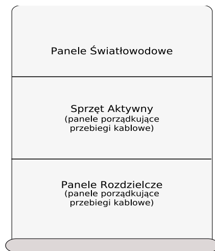
Rys. 2: Rozkład elementów w szafach punktów rozdzielczych.